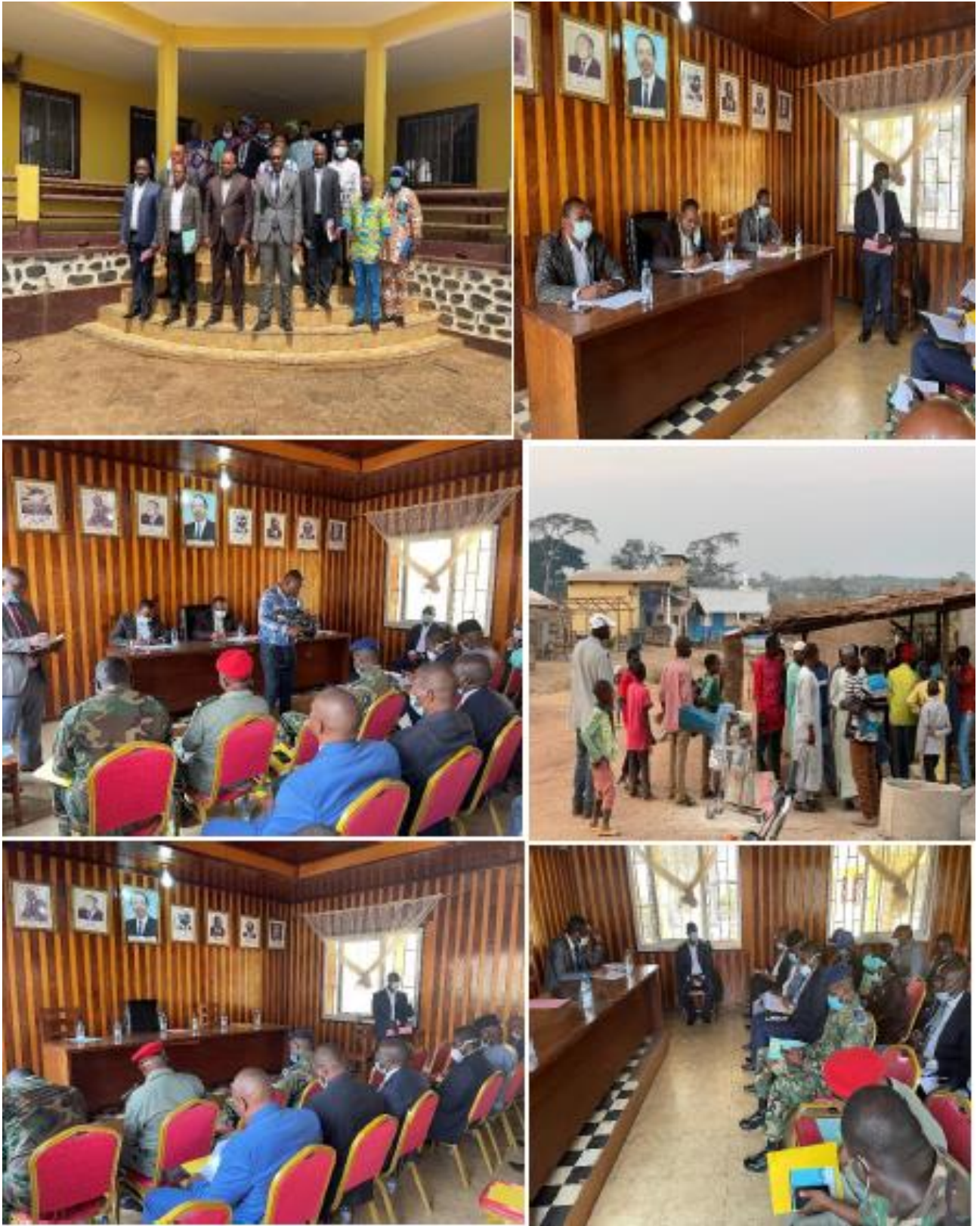
Figure 3. Photos de consultation publique à Bertoua (Région de l'Est).