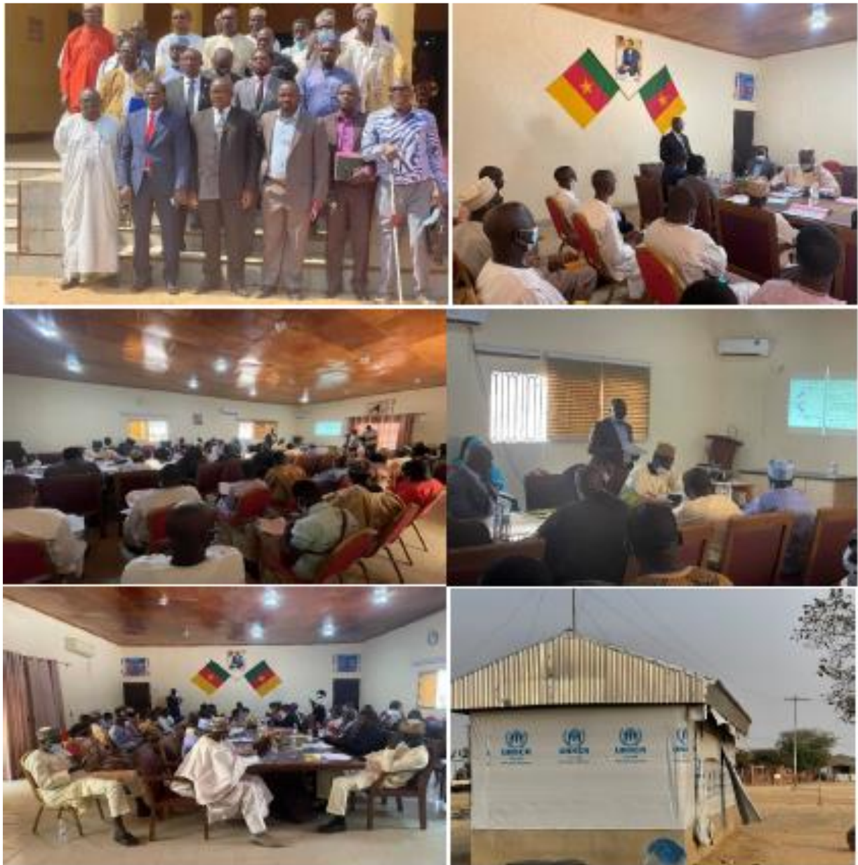
Figure 4. Photos de consultation publique à Maroua (Région de l’Extrême-Nord).

“Concernant l’approvisionnement des agriculteurs en intrants, il serait préférable de les rassembler en coopérative afin de faciliter la répartition.”