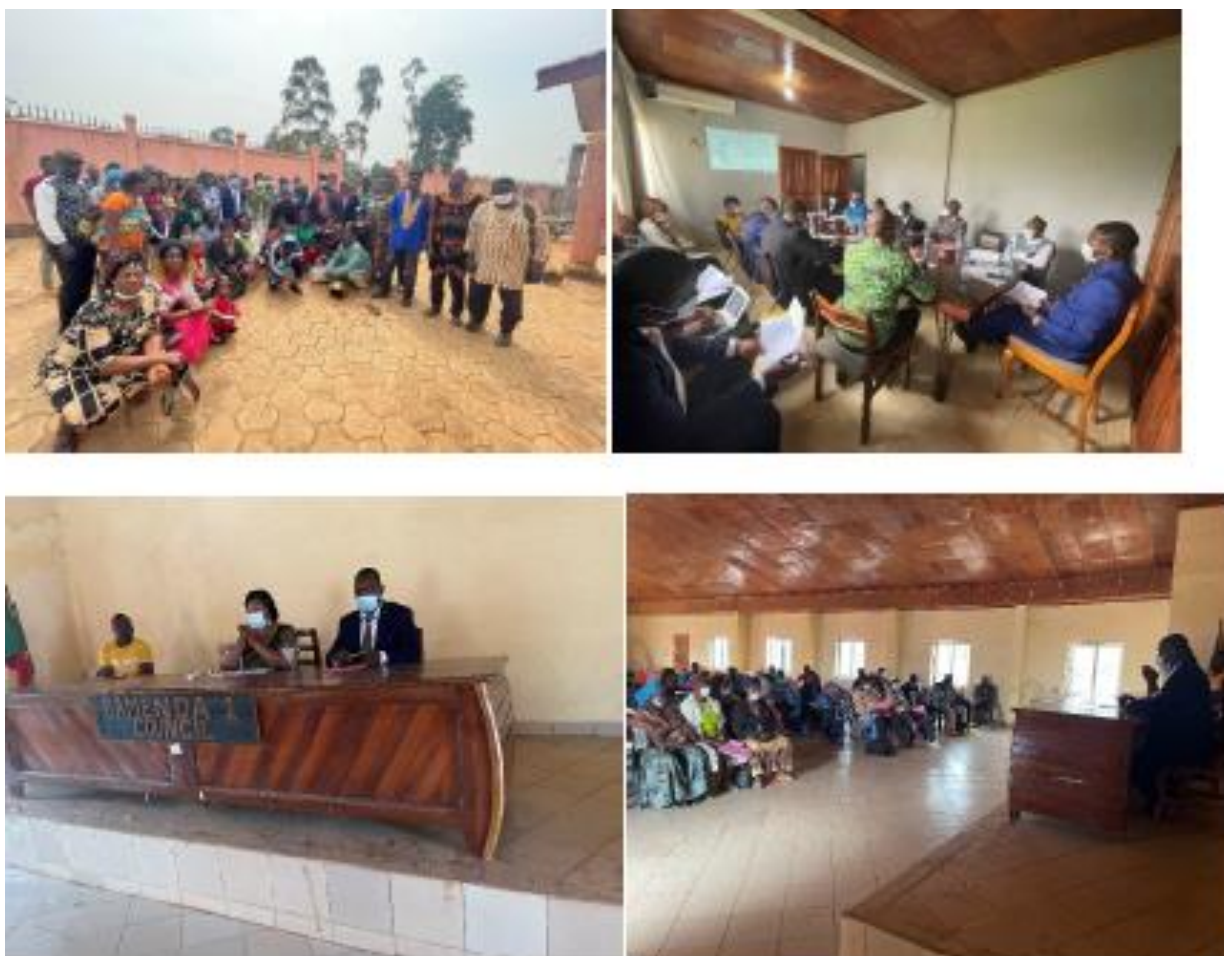
Figure 6. Photos de consultation publique à Bamenda (Région du Nord-Ouest).